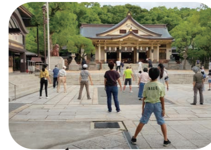
早起きは三文の徳