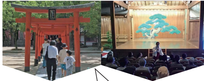
湊川神社で地域探訪